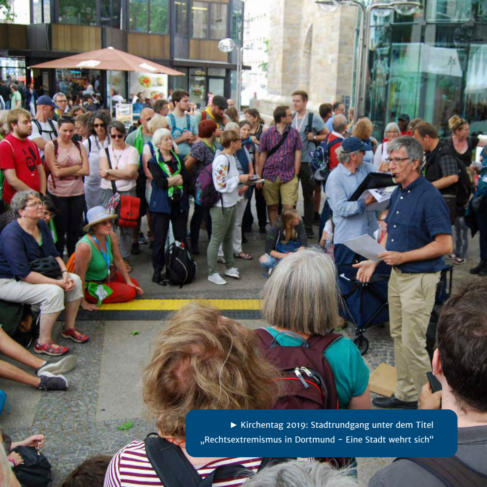
► Kirchentag 2019: Stadtrundgang unter dem Titel „Rechtsextremismus in Dortmund – Eine Stadt wehrt sich“