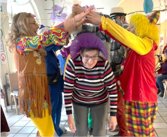
Rosenmontagsparty - Spaß und Freude für alle