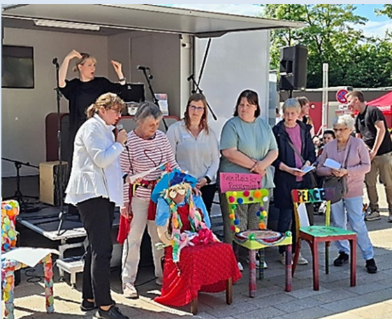
„Bitte Platz nehmen“