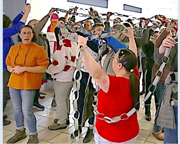
Weltweit tanzen gegen Gewalt an Frauen